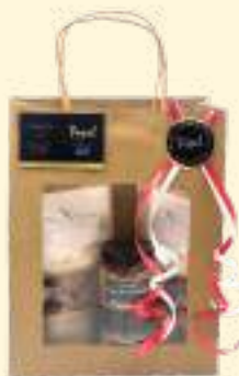
Le Salé 1*