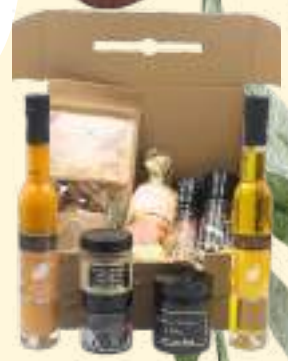
KIT C* *Photo non contractuelle

Vinaigre à la pulpe de Mangue POPOL 100ml - Huile d'Olive vierge aromatisée à la Truffe d'été 250ml - Moulin Diamant de sel POPOL 115g - Moulin Baies de Timut POPOL 30g - Compotée d'Artichauts aromatisée à la Truffe d'été POPOL 90g - Confit d'Oignons POPOL 160g - Confiture à la Figue de Solliès POPOL 250g - Navettes à la Fleur d'Oranger BIO MN 150g