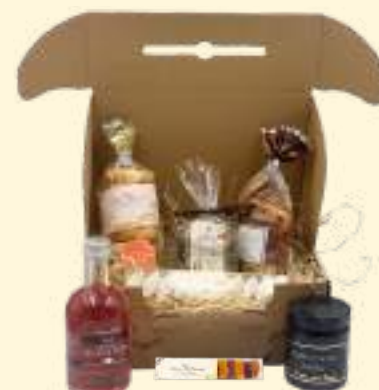
Coffret Gourmand de Provence* *Photo non contractuelle