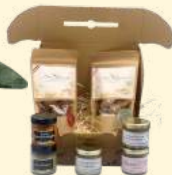
Le Salé 2*