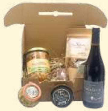
Le Prêt à manger* *Photo non contractuelle