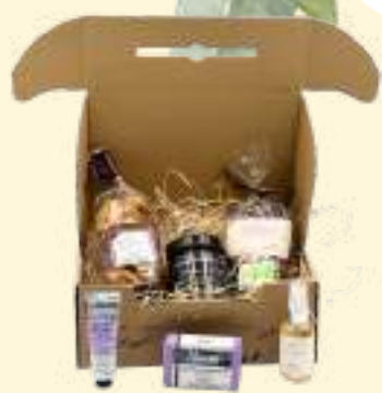
Bien-être et Gourmandise* *Photo non contractuelle

Savon de Provence LA CORVETTE 100g* - Brume parfumée MADEMOISELLE BULLE 50ml* - Baume pour les mains LA CORVETTE 30ml* - Confiture Figues de Solliès POPOL 250g - Chocolat (lait ou noir) Amandes & Noisettes à la casse BIO MN 150g - Sablés aux pépites de Chocolat BIO MN 150g - Canistrellis Fleur d'Oranger et Ecorces d'Oranges confites BIO MN 150g *Parfums assortis